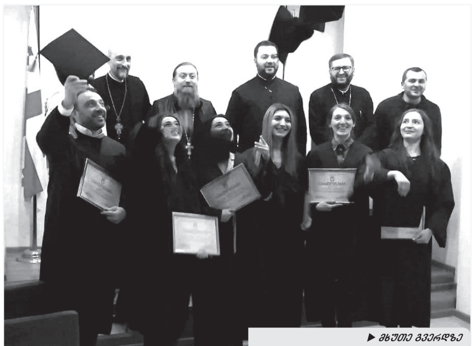
► ახალი გვერდი